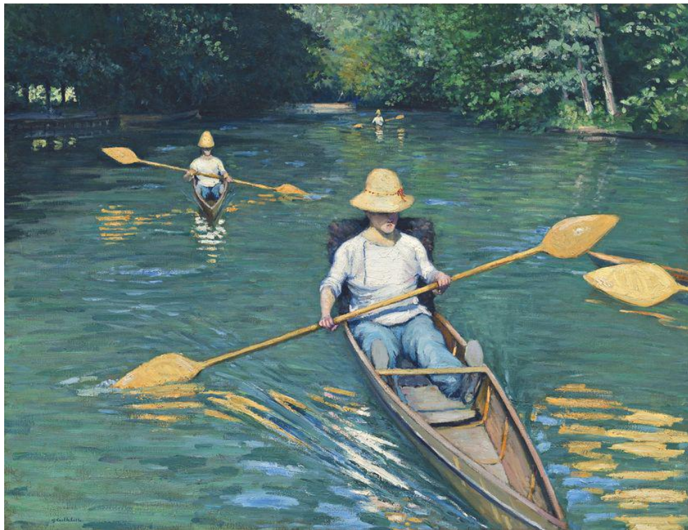
Périssoires sur l'Yerres, 1877. Huile sur toile, 88,9 × 116,2 cm. Washington, National Gallery of A • Crédits : Gustave Caillebotte // Hazan