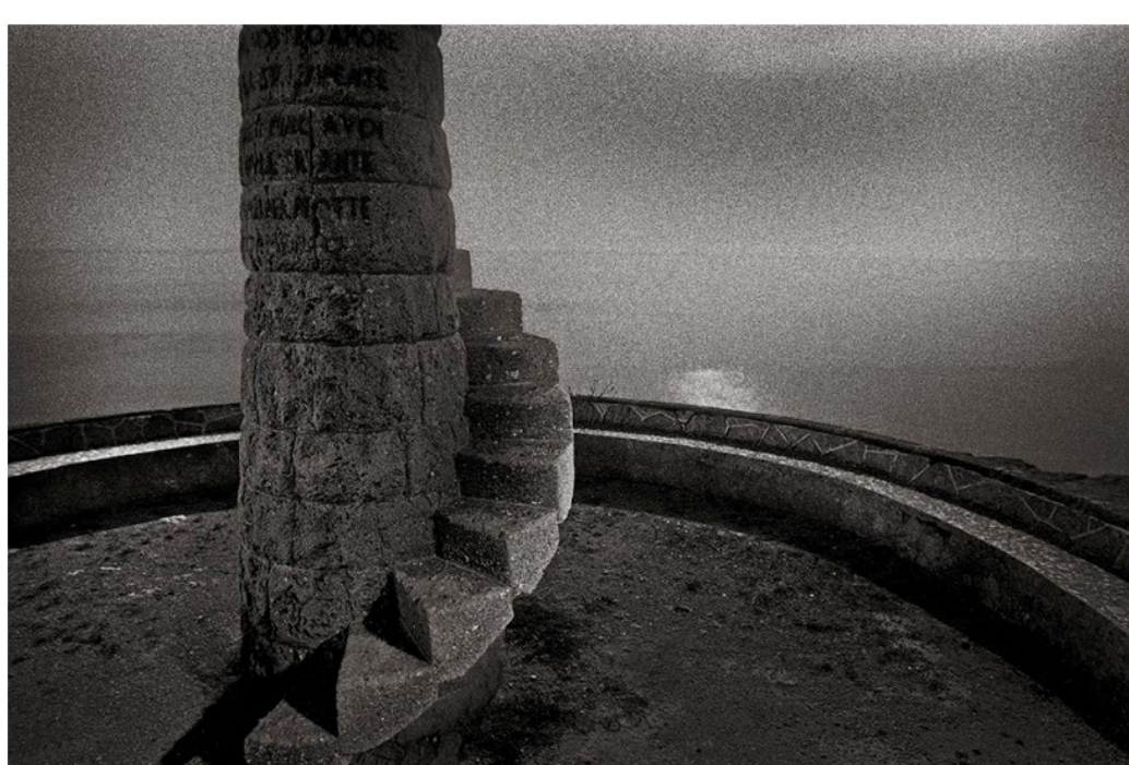
Monument en bord de mer à Santa Cesarea, à proximité du point extrême sud du talon de la botte de l'Italie, 1993. Série "De finibus terrae" © Alain Willaume / Tendance Floue - Extrait de Alain Willaume, Coordonnées 72/18 (Éditions Xavier Barral, 2019)