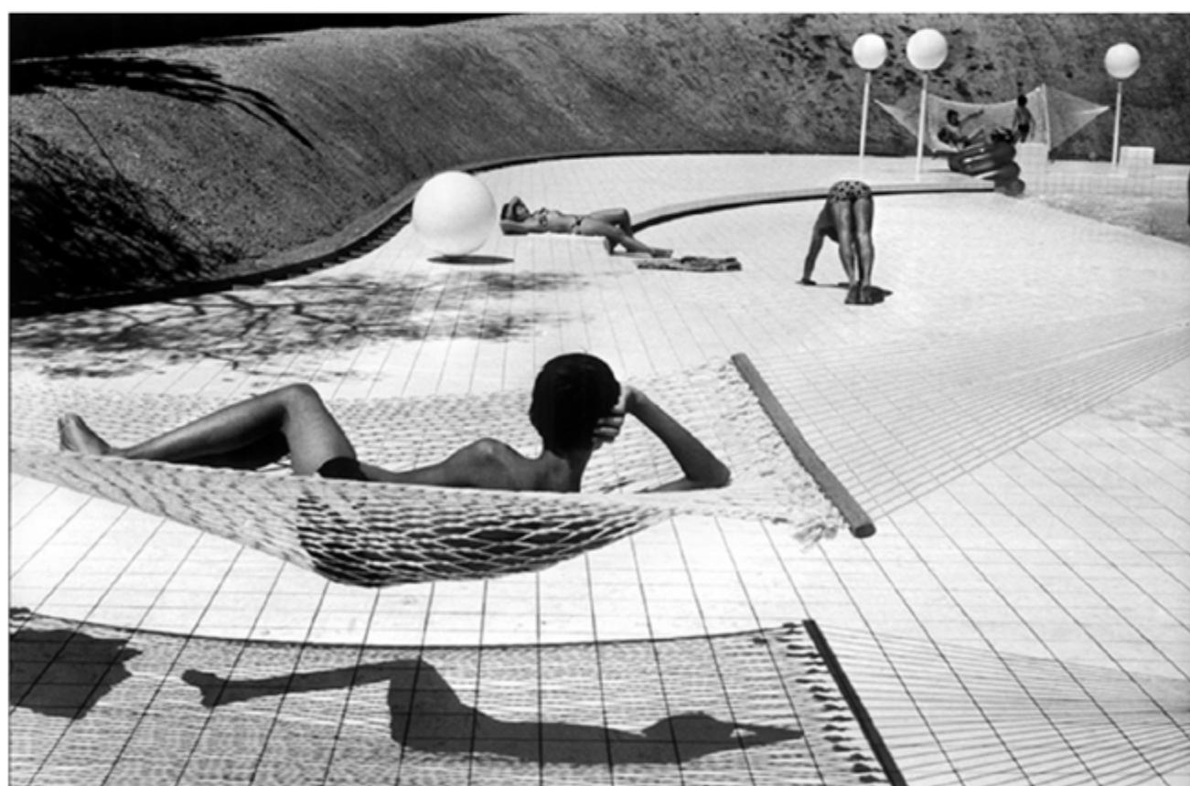
Piscine conçue par Alain Capellères, Le Brus, été 1976

Pour baptiser ses nouveaux locaux, la Fondation Henri Cartier-Bresson a choisi de rendre hommage à celle qui a longtemps dirigé l'institution, avec cette première grande rétrospective consacrée à l'œuvre de la photographe belge.