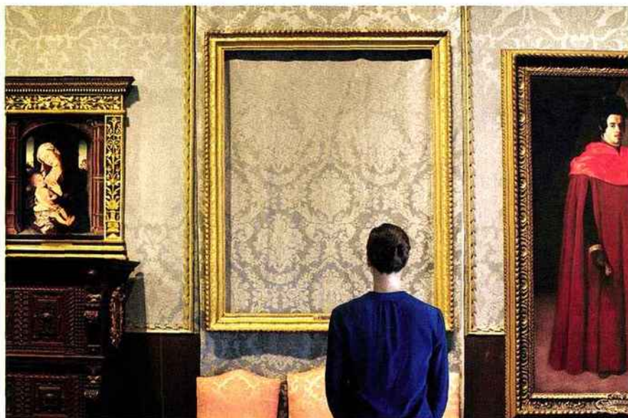
Que voyez-vous? (Rembrandt, «La Tempête sur la mer de Galilée»), 2013 [détail]