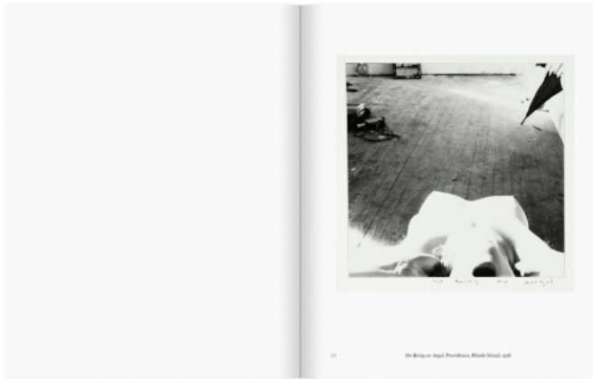
Francesca Woodman, Devenir un ange, Editions Xavier Barral, 2016, pages intérieures

11 MAI 2016 - FRANCE , ECRIT PAR L'OEIL DE LA PHOTOGRAPHIE