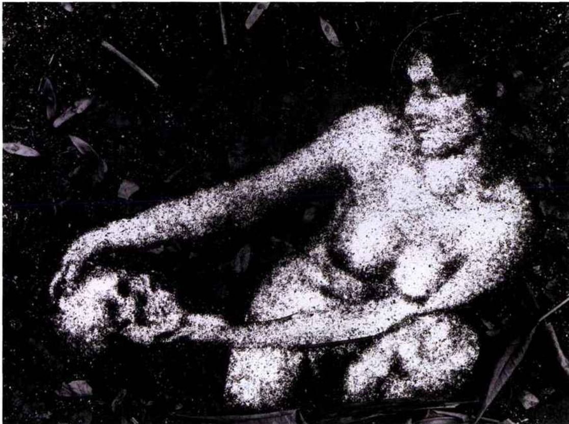
Vik Muniz, Laughter (Girl with skull) , 1997 © Vik Muniz

23 AVENUE JEAN MOULIN 75014 PARIS - 01 40 05 09 89