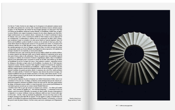
Page de droite : Bracelet en forme de roue, époque des Kofun, IVe siècle