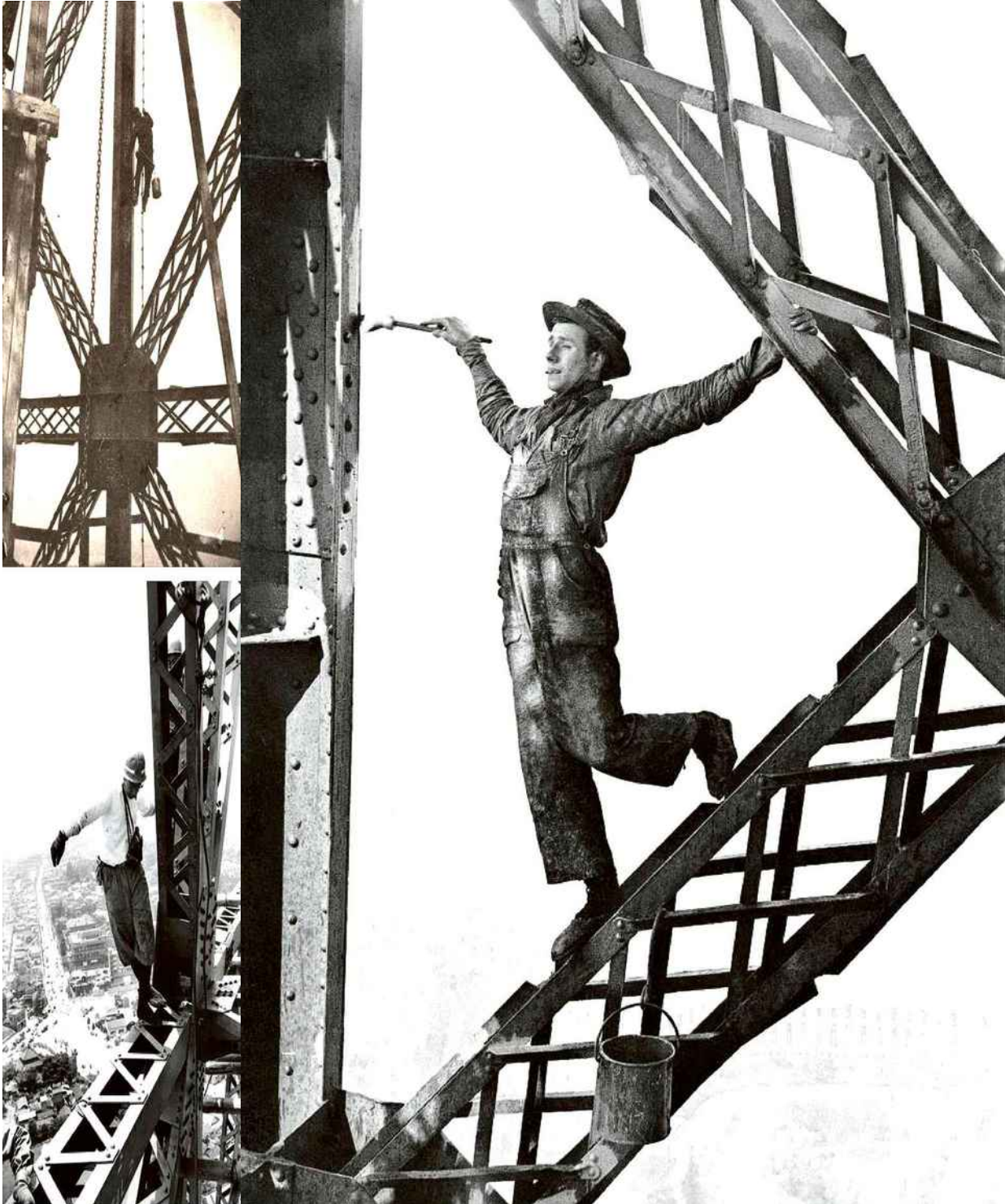
Page de gauche, en haut: la photo du Peintre sur une corde à noeuds réalisée par Henri Rivière sur le chantier de la tour Eiffel en 1889.