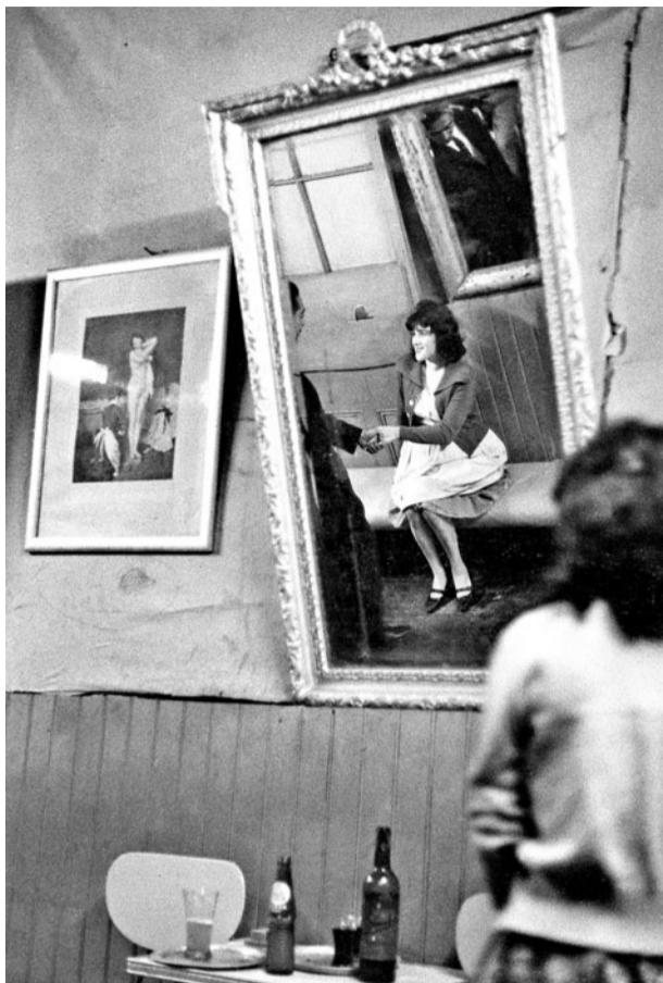
►► Valparaíso 1963.