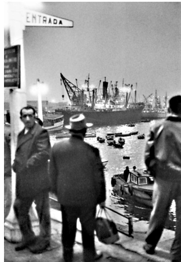
►► Valparaíso 1963.

[PUBLICACION] Circuló a modo de objeto de culto en los 90, pero hoy vuelve a las estanterías. Valparaíso , el libro del fotógrafo y único chileno miembro de la Agencia Magnum, se reedita con escritos del propio autor y 82 fotos inéditas que reflejan su faceta de ecologista y asceta. Por Denisse Espinoza A.