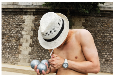
Paris Plage 2012

Le photographe se plaît alors à immortaliser plagistes, vacanciers et autres touristes dans leurs rôles les plus parfaits. L'angle est choisi avec soin, la scène idéale, celle d'une société qui consomme, sans vergogne. Du touriste le plus original installé sur sa chaise de plage, son magazine à scandales en main, au visiteur de musée avide avant tout d'immortaliser les moindres détails à l'aide de son smartphone, tout est passé au crible de l'objectif de Martin Parr.