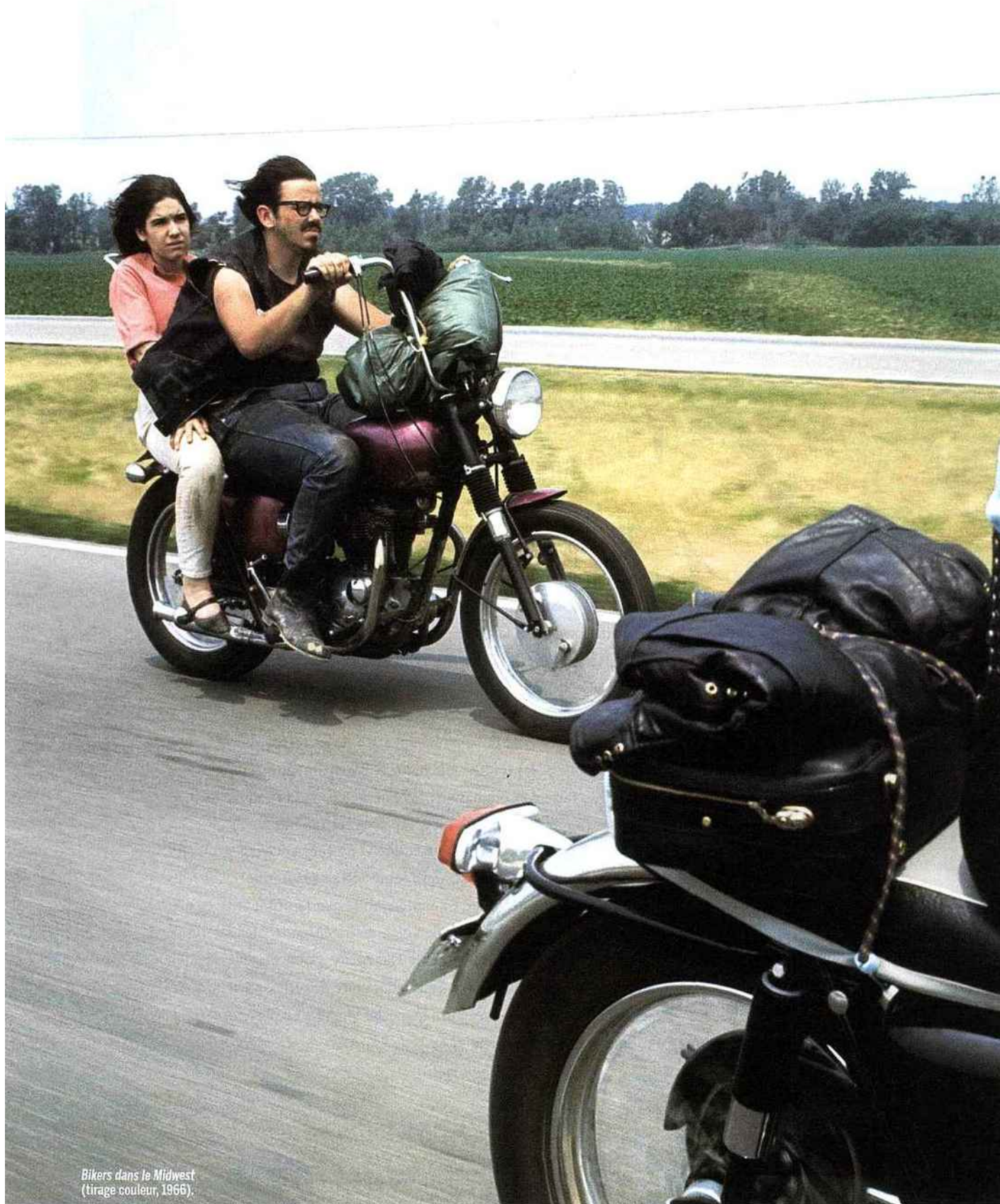
Bikers dans le Midwest (tirage couleur, 1966).