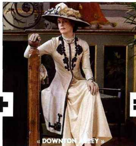
« DOWNTON ABBEY »