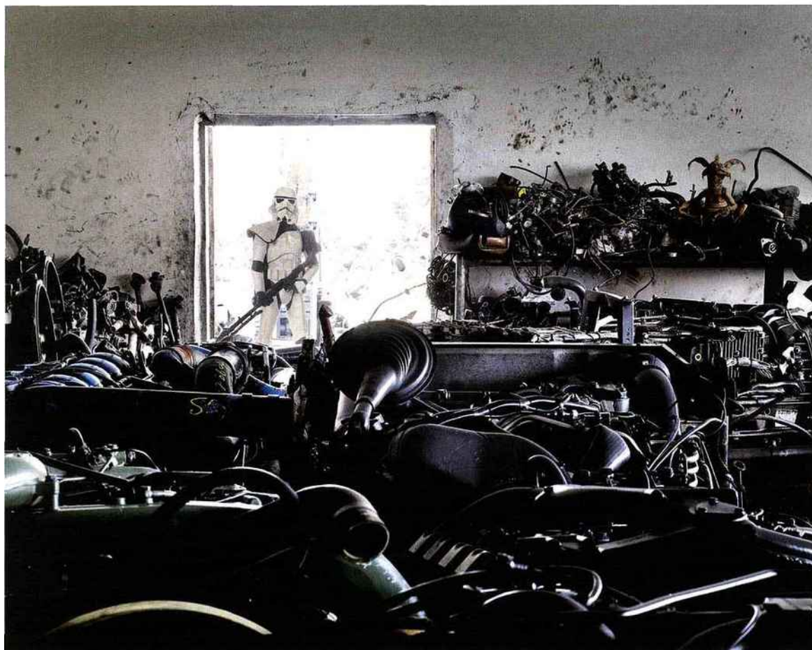
© Cédric Delsaux, The Hyperdrive Store, Dubai, 2009. Courtesy Acte 2 Photo