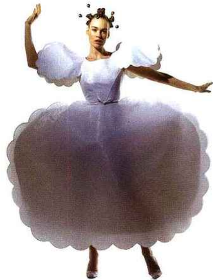
La robe nuage