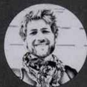
Par Benjamin Favier

C'est une tradition solidement ancrée dans notre agenda éditorial. Une fois les portes du Salon de la Photo et de Paris Photo refermées, nous nous ruons sur les piles de livres reçus tout au long de l'année. Certains d'entre eux ont déjà fait l'objet de chroniques, dans les précédents numéros ( Datazone , Cimmarron , Au hasard des vents... ). Toutefois, la grande majorité est inédite. Parmi la sélection, les thématiques environnementales occupent une place importante : Arktos , Les derniers peuples des glaces , Contemplation , Contaminations , Datazone , Des oiseaux , Au hasard des vents , Evanescence , prennent, chacun à leur manière, le pouls de notre planète. C'est également