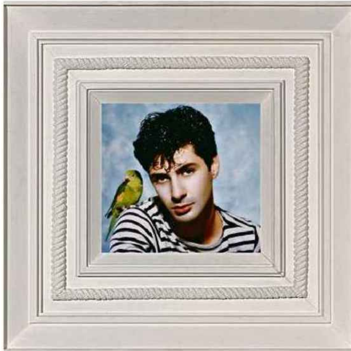
Etienne Daho, pochette de la Notte, la Notte...

inquiétude, teintée d'apocalypse ( Wonderful Town pour M). C'est sans doute parce que les plus belles images de la vie sont aussi celles qui nous pincent le cœur.