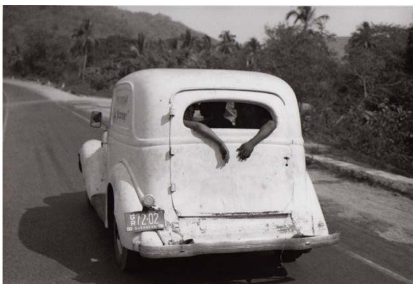
Bernard Plossu, Sur la route d'Acapulco , Mexique, 1966, série « Le Voyage mexicain », tirage gélantino-argentique, 18 × 27 cm.

L'automobile et le développement des autoroutes offrent de nouveaux grains à moudre aux photographes, des rubans d'asphalte et vertigineux échangeurs des mégapoles, un « sublime accéléré », comme le résume la photographe Sue Barr, qui a capturé à Naples ce point de vue surréaliste : une petite bâtisse ancienne coincée, ou plutôt étouffée, sous les