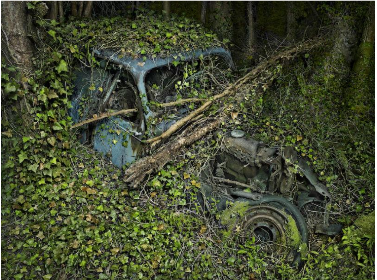
Citroën Traction 7 , 2012.