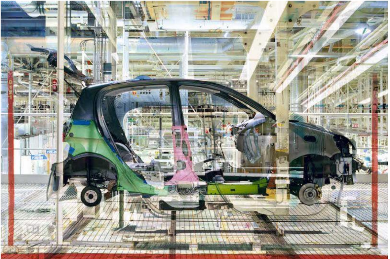
MELT, Toyota n° 8, 2005. (© Stéphane Couturier, collection de l'artiste, fonds La Galerie Particulière, Paris/ Bruxelles)

"Autophoto", du 20 avril au 24 septembre 2017 à la Fondation Cartier pour l'Art Contemporain à Paris.