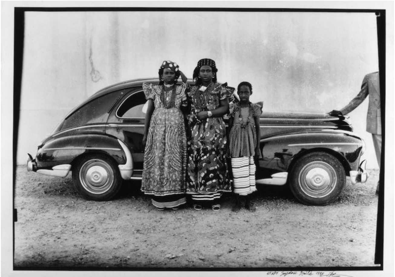
Sans titre, 1952-1955.