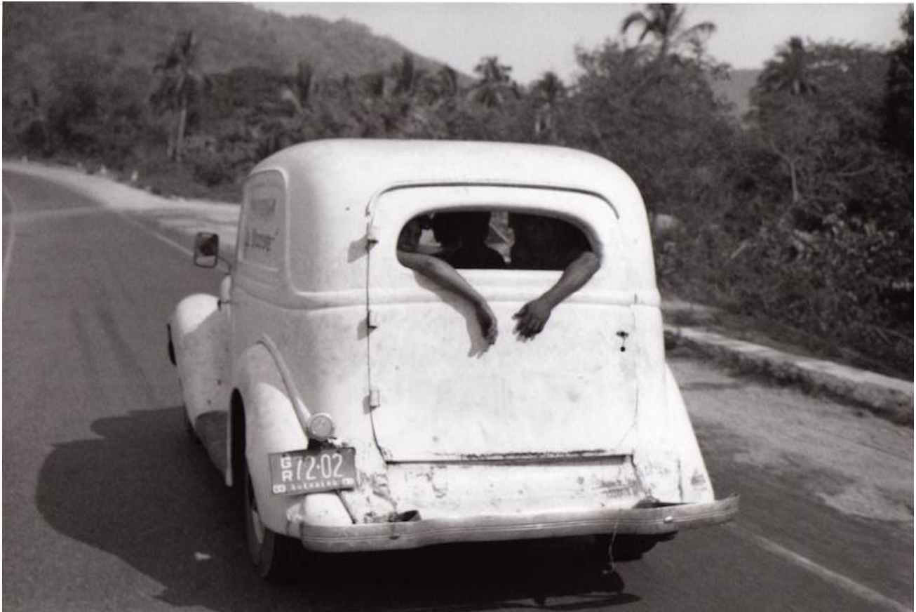
Sur la route d'Acapulco, Mexique, 1966, série Le Voyage mexicain. (© Bernard Plossu/avec l'aimable autorisation de l'artiste/Galerie Camera Obscura, Paris)