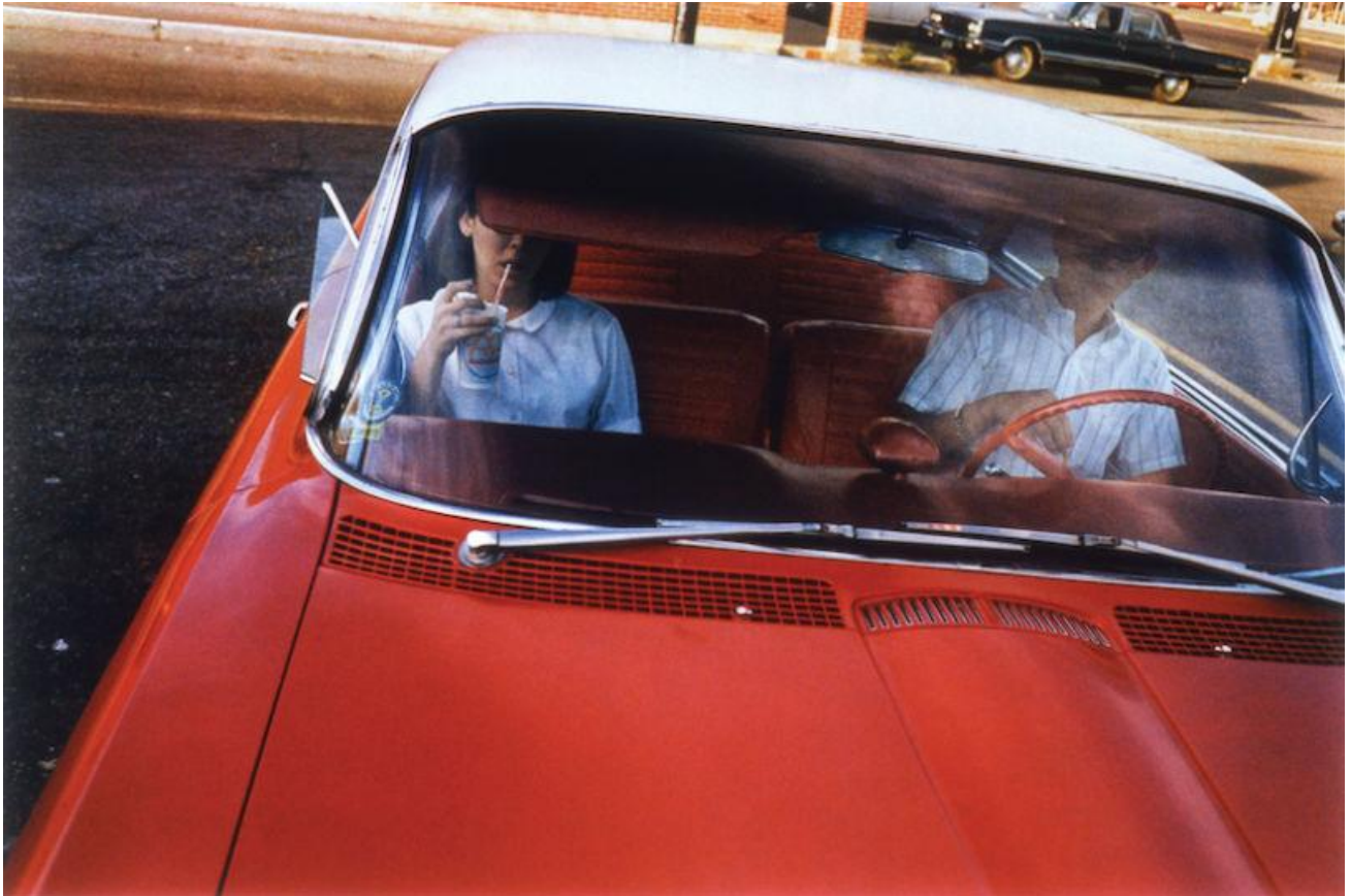
Los Alamos, 1965-1968.

Badly Repaired Cars, 2016 Tirage jet d'encre