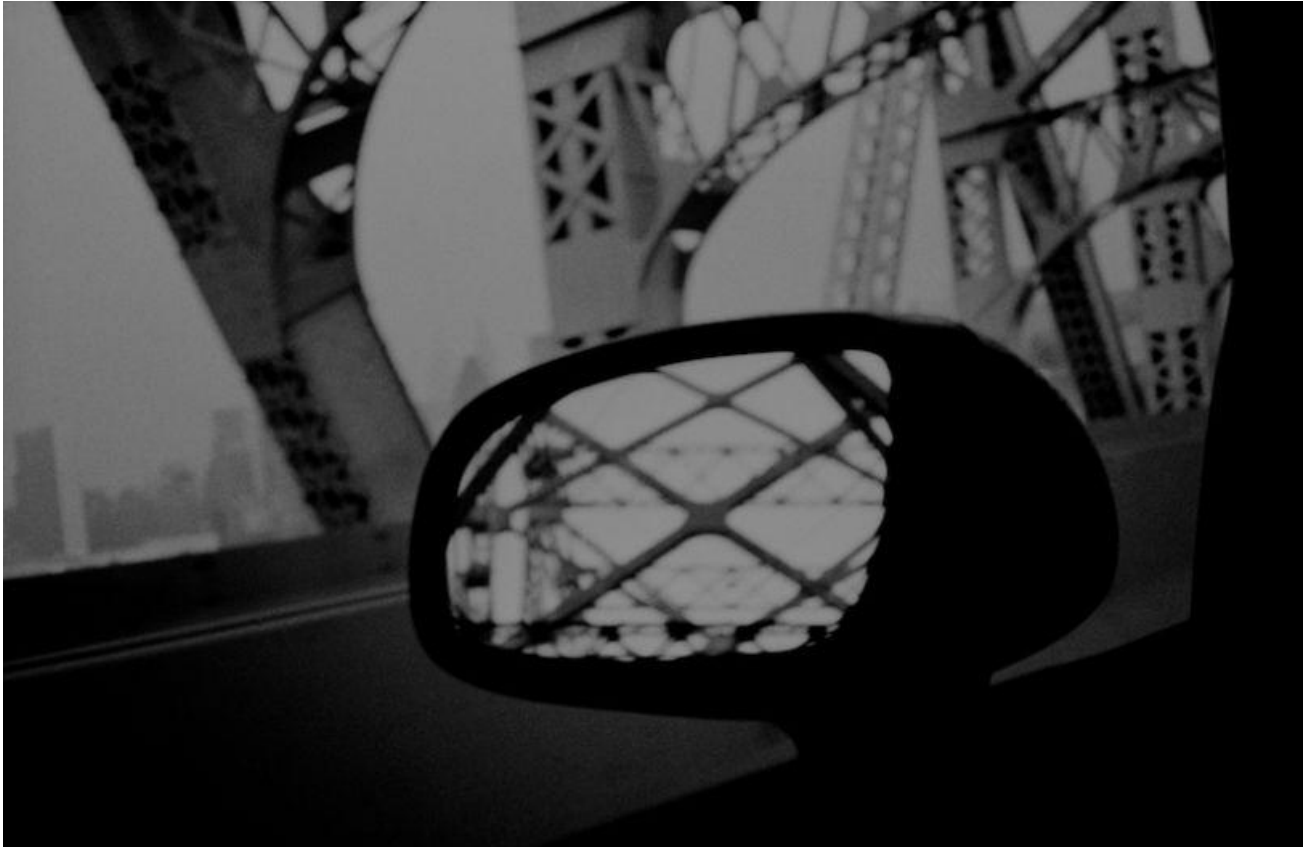
Coaster Ride Stealth, 1994, série Drive-By Shootings. (© David Bradford)