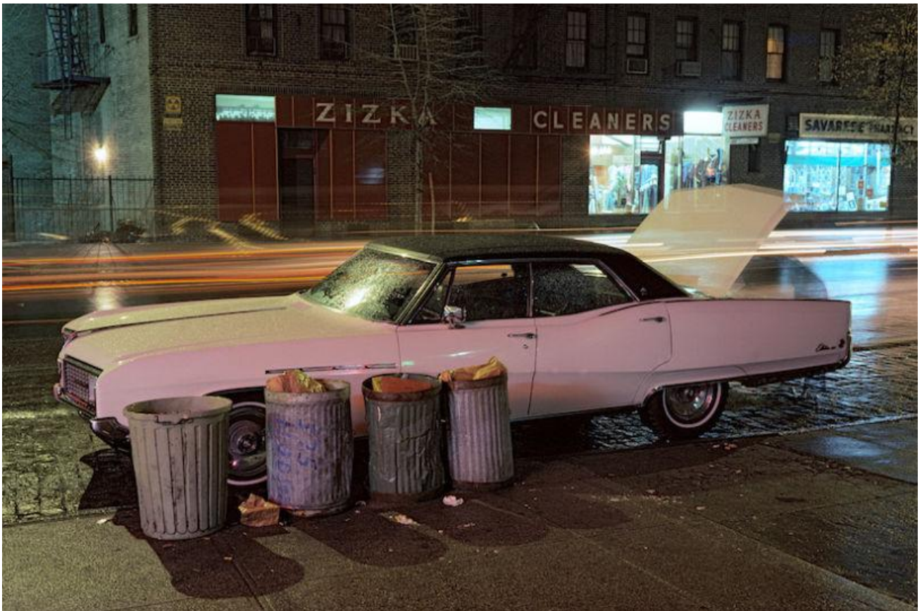
Zizka Cleaners car, Buick Electra, New York, 1976.

The Carpoolers , 2011-2012. Installation de 15 tirages jet d'encre.