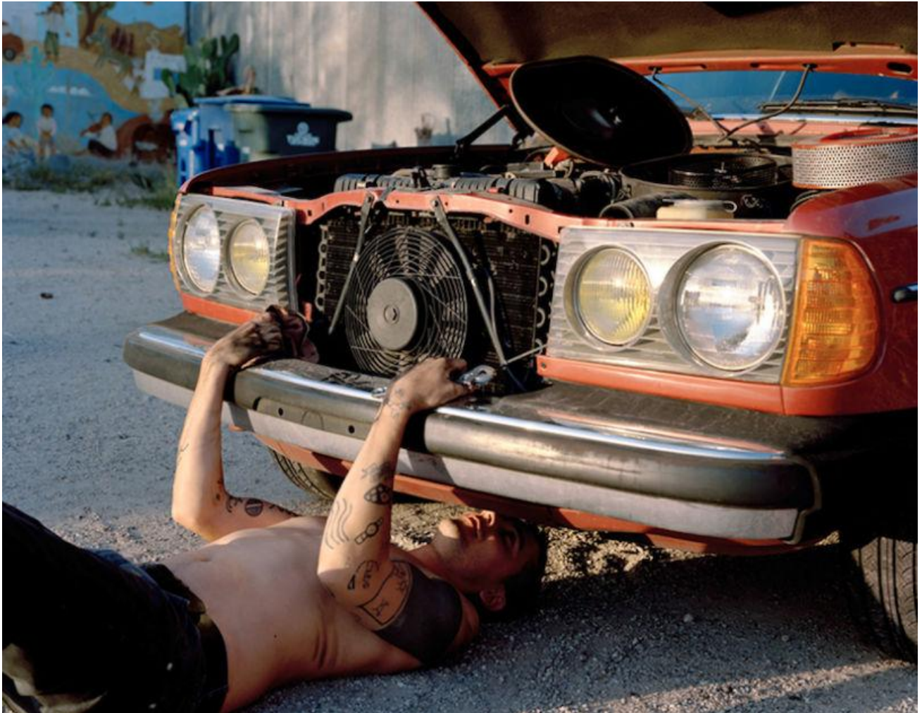
280 Coup, 2012. (© Justine Kurland, avec l'aimable autorisation de l'artiste/Mitchell-Innes & Nash, New York)