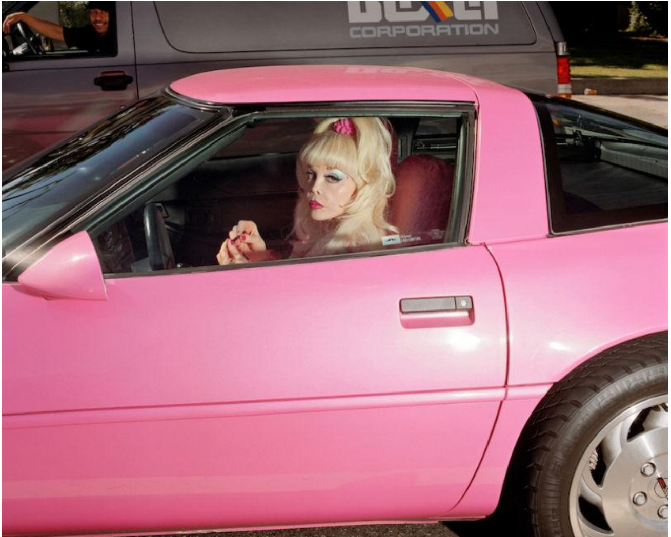
Femme qui attend à Highland Boulevards, Los Angeles, approximativement à 11 h 59, un jour de février 1997, 1997.