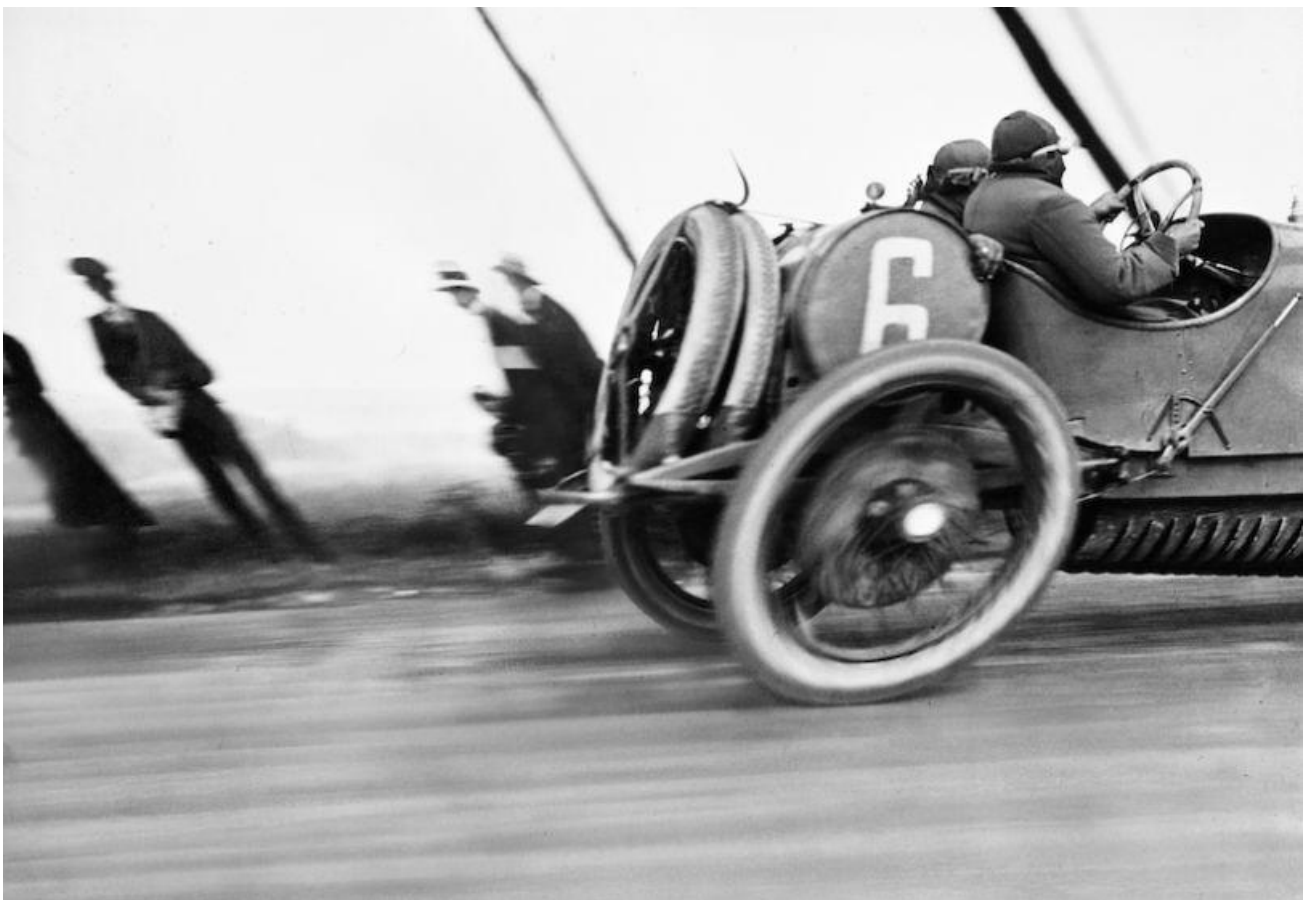
Une Delage au Grand Prix de l'Automobile Club de France, circuit de Dieppe, 26 juin 1912, Jacques Henri Lartigue. (© Ministère de la Culture – France/AAJHL)

Depuis le 19 avril, la Fondation Cartier propose une exposition intitulée "Autophoto". À travers de nombreuses images, elle met en évidence les liens étroits qui existent entre voiture et photographie.