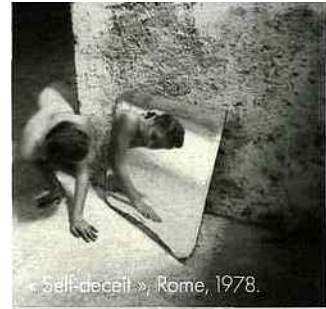
« Self-deceit », Rome, 1978.

« FRANCESCA WOODMAN, ON BEING AN ANGEL », jusqu'au 31 juillet, Fondation Henri Cartier-Bresson, Paris-14*.