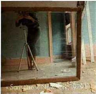
« Sans titre », New York, 1979.