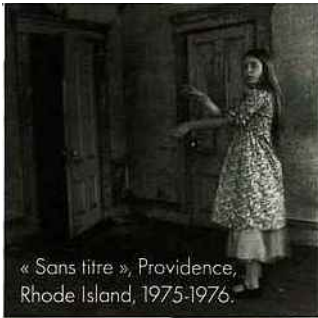
« Sans titre », Providence, Rhode Island, 1975-1976.