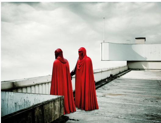
8/10 Red Guards, Paris, 2005.