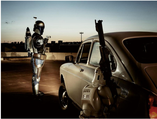
6/10 Jango Fett, Paris, 2005. CEDRIC DELSAUX /