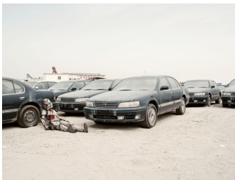
3/10 Death Trooper, Dubai, 2011.