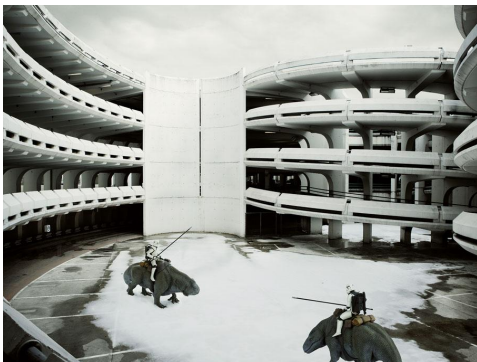
7/10 Two Sandtroopers, Paris, 2005. CEDRIC DELSAUX /