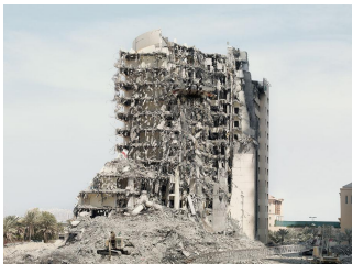
5/10 The Crash, Dubai, 2009.