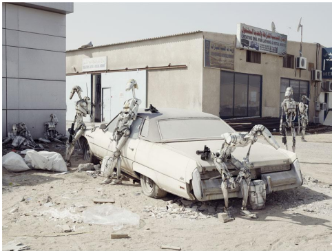
10/10 The Buick, Dubai, 2009. CEDRIC DELSAUX / EDITIONS