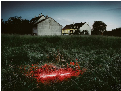
2/10 Lightsaber, Paris, 2005. CEDRIC DELSAUX / EDITIONS XAVIER