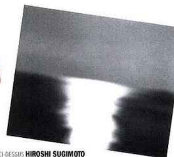
CI-DESSUS HIROSHI SUGIMOTO Bay of Sagami, Atami, 1997 [Nég. #489]

La chemise Touriste par Untel 100 ex. signés et numérotés éd. MFC-Michèle Didier - 190 € www.micheledidier.com