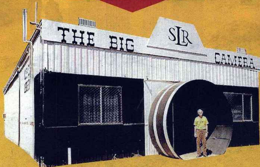
PHOTO OLIVIER CABLAT - «A THEORY OF EVOLUTION», EDITIONS DUCK (RVB BOOKS)