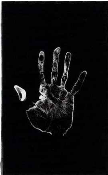
Ugo Mulas Verification 7, Le laboratoire Une main developpe, l'autre fixe A sir John Frederick William Herschel, 1972