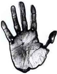
© UGO MULAS, HUBS, AUL, BASTIN, HENRY P. © STEVE FORTINHO, INALANCO / PHOTOFUNCEY / ENSEMBLE-OP